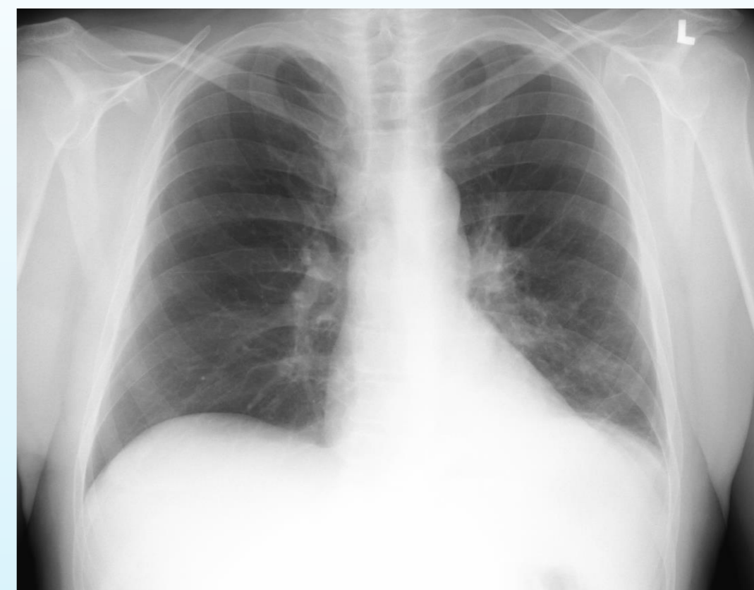
Vývoj na snímku hrudních orgánů během 1 měsíce

V literatuře je popsáno jen osm případů metastázy plicního tumoru do močového měchýře. V případě našeho pacienta se jednalo o rychle progredující a komplikované onemocnění, tudíž kurativní onkologická léčba nemohla být provedena. Dle literárních zdrojů je doporučen multimodální přístup.