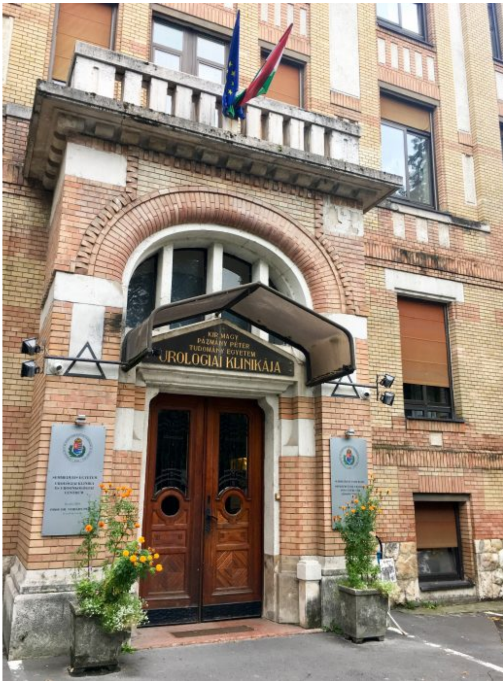
Urologická klinika Semmelweisovy Univerzity, Budapešť